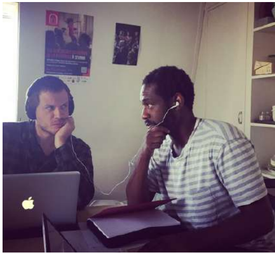
En répétitions La Poudrerie à Sevran - septembre 2020

Durant tout le spectacle, ils cherchent une façon d'incarner, de jouer et de dire qui se laisserait faire par la douceur, qui ne voudrait ni prouver, ni montrer. Ils cherchent un chemin pour baisser les armes et se libérer des attentes qui pèsent sur eux. Ils éprouvent, par le jeu, des voies possibles pour s'émanciper des représentations attendues du masculin et de la virilité.