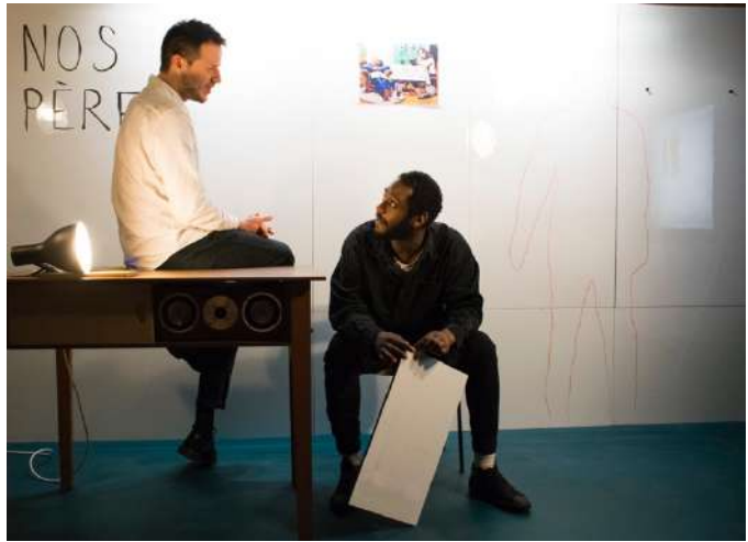
En répétitions à Malakoff dans le décor, février 2021