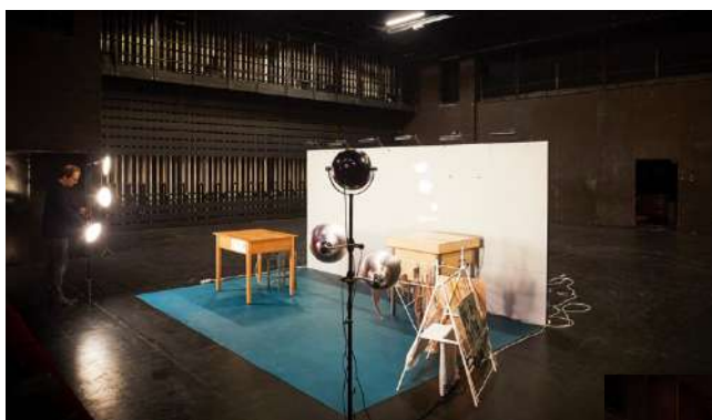
Moyenne version, le décor de face

Pour chacune d'elles, mur du fond et sol sont augmentés, permettant de s'implanter facilement en appartement devant 20 à 30 personnes comme en salle devant un public d'une centaine de spectateurs.