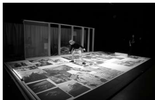
Ce qui demeure (2016)

Entre janvier 2018 et décembre 2020, la compagnie est en résidence d'implantation triennale à Herblay-sur-Seine et crée Autoportrait d'une jeunesse (2020) avec 11 jeunes adultes du territoire.