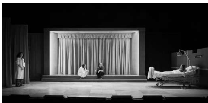
A la vie ! (2020), ©Christophe Raynaud de Lage

En 2016, la création Ce qui demeure , ouvre un cycle de recherche et de création avec la même équipe. Suivront Saint-Félix, enquête sur un hameau français (2018) et A la vie ! (2020), créé à la MC2 Grenoble. Ces trois pièces sont au répertoire et tournent à travers toute la France.